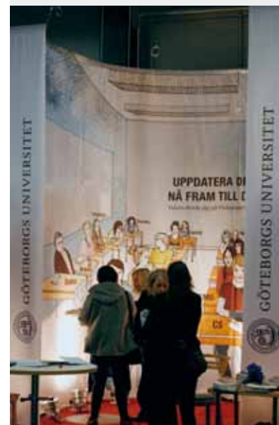
Fakultetens monter på mässan Mötesplats Skola i november 2010.

30 av de egna nyheterna på Utbildningsvetenskapliga fakultetens webbplats översattes under 2010 till engelska. Flertalet av de engelska nyheterna publicerades på internationella portaler för forskningsnyheter.