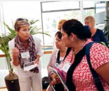
OMEP-kongressen Children, citizens in a challenged world hölls vid fakulteten i augusti.