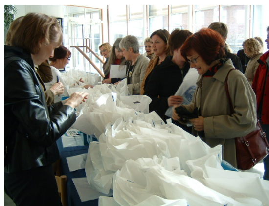
”Spindeln i Nätet” vid Göteborgs universitet den 21 – 22 april (högskoleadministratörer från hela landet deltog)

IPD har också samverkat och medverkat med planeringsarbete, administration, föreläsare och utställningar vid ett antal konferenser och nätverksträffar etc. under året. Några exempel: ”LMS Språkdagar 2005” i Skövde den 9 – 10 april, nätverksmöten med Göteborgs universitets externa relationer, samt vid regionala RUC-möten etc.