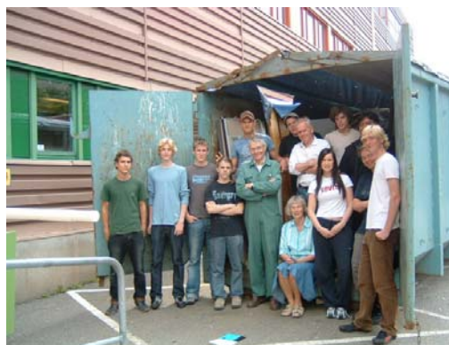
Gruppen som under sommaren 2005 påbörjade utrensningen av "Gamla Pedagogen"